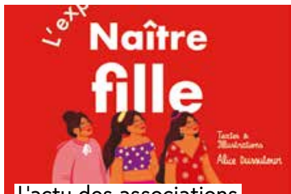
L'actu des associations