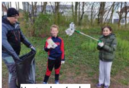
L'actu des écoles